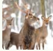
Cerf de Virginie