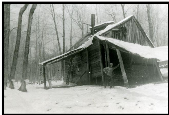
L'ancienne cabane chez Nelson Veilleux, 1975 Collection Alberta Viau Veilleux Site Internet : https://histoire.compton.ca

Les Mémoires vives de la Société d'histoire proposent, ce mois-ci, une rétrospective portant sur le temps des sucres. Cette activité à laquelle les pionniers de Compton se sont adonnés constitue, encore de nos jours, un secteur de l'activité agroalimentaire où nos producteurs excellent. Quelque soit le niveau