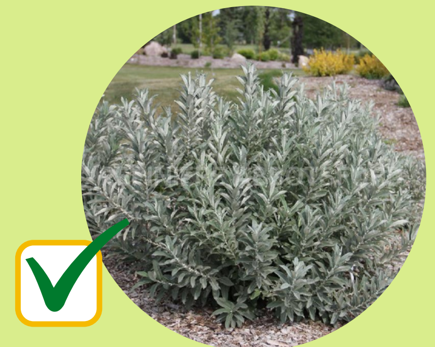
ARBUSTE : SALIX ICEBERG ALLEY

Les arbres sont gracieusement offerts par le Ministère des Forêts, de la Faune et des Parcs.