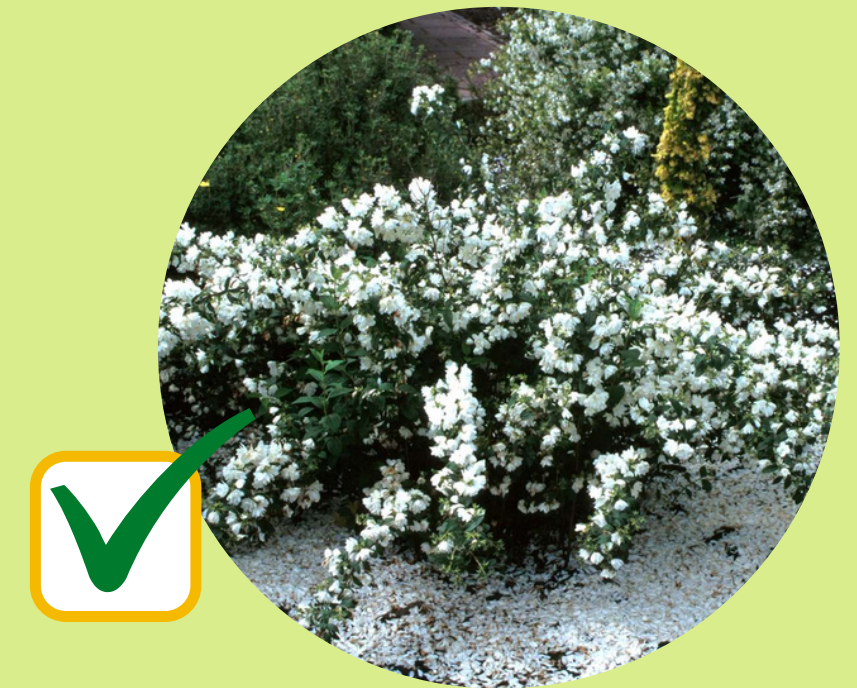
ARBUSTE : PHILADELPHUS 'SNOWBELLE' (VIRGINALIS)