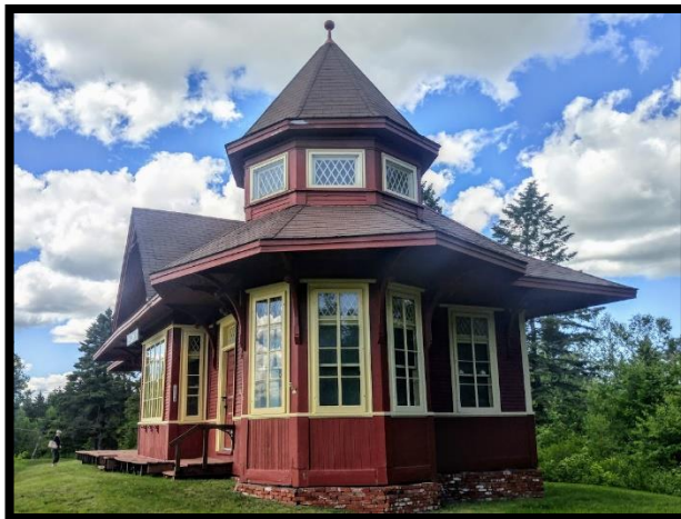
La Vieille gare de Compton.

Les Mémoires vives de la Société d'histoire vous proposent, pour compléter l'année 2018-2019, de jeter un regard sur la Vieille gare de Compton et de ce qui l'a entourée. Disparue du paysage comptonois en 1970, la Vieille gare a une seconde vie ailleurs; mais que nous reste-t-il des quelque 170 ans d'activités ferroviaires à Compton? Des souvenirs, quelques photographies et quoi d'autres?